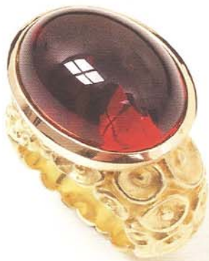
Die goldene Ringschiene mit Blütenkelchrelief kombiniert GITTA PIELCKE mit einem großen Granatcabochon in tieferer Farbe. www.gitta-pielcke.de

4 Uhrensammlerbox Atlas für 6 Uhren. Als Einzelstück, passend zu allen Uhrenbeweger des Typs Atlantic. Oberfläche Rosenholzdekor und Innen reich im schwarzen Samtlook.